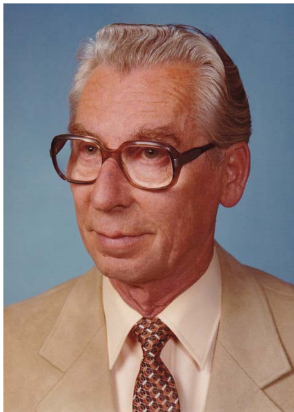
Hans Blank (1919 – 2006)